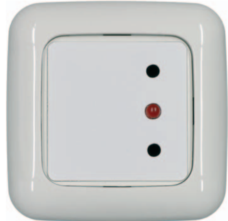
Abbildung, ZFEUP mit 1fach-Rahmen, Adapterrahmen und Zentralstück

Gleiche Funktion wie der normale Zimmerfunkempfänger. Allerdings erfolgt der Einbau „Unter Putz“ in eine handelsübliche Schalterdose. Durch den Einsatz von DIN-Rahmen mit 50x50mm Maß, kann der Empfänger in jedes Schalterprogramm von deutschen Markenherstellern (Busch-Jaeger, Gira, Jung, Berker usw.) eingesetzt werden.